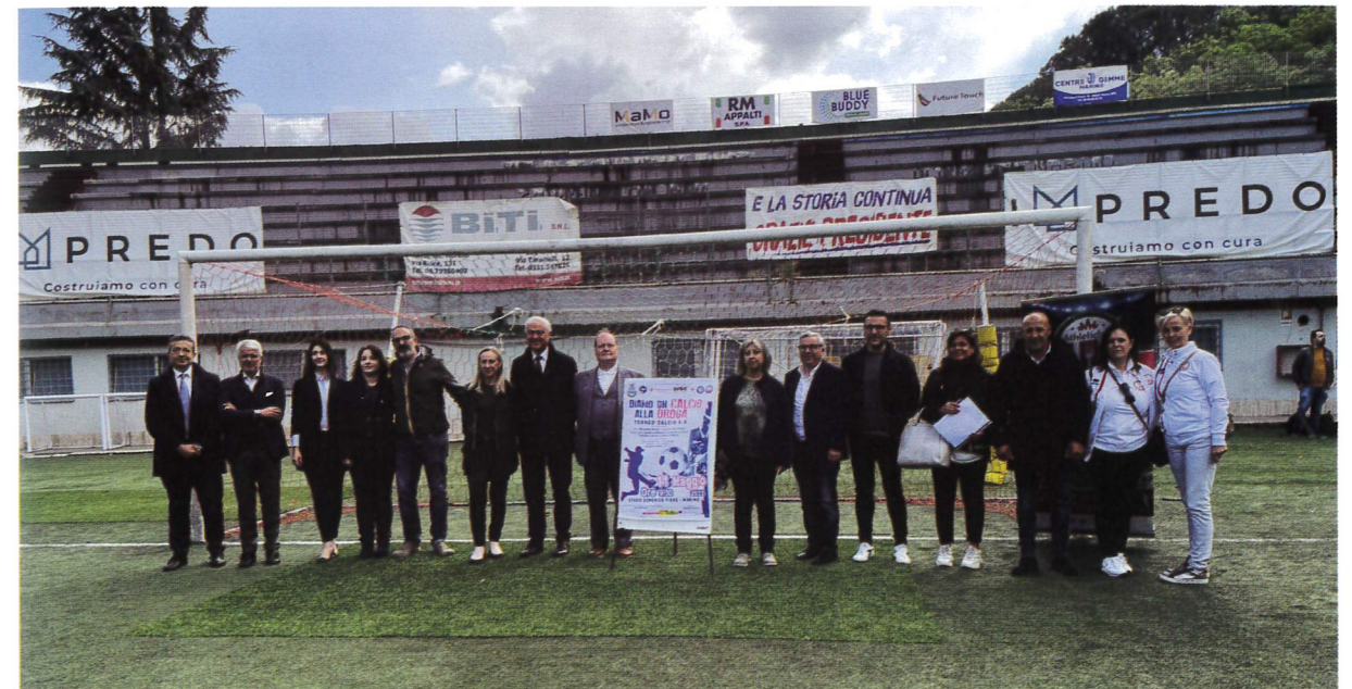
L'Amministrazione comunale con i collaboratori del progetto

culturale per la prevenzione di tutte le forme di tossicodipendenze e di ogni forma di marginalità e disagio sociale. Il contrasto alla droga deve proseguire senza sosta in maniera efficace e costante".