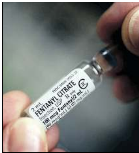
Il simil fentanyl viene venduto in fiale