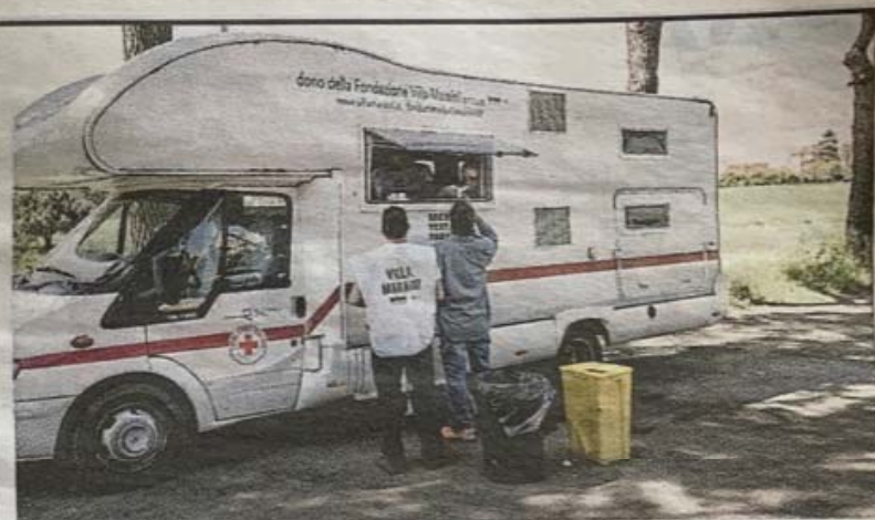
Il mezzo di soccorso mobile

«L'ultimo intervento l'abbiamo fatto 5 minuti prima di andare via da Tor Bella Monaca, se fosse accaduto 5 minuti dopo, l'utente sarebbe probabilmente